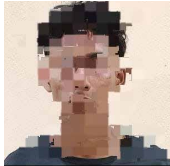
nd UMEP 18 TELA

La Policía Nacional a través de sus Unidades, continúa dando respuesta inmediata a todas las denuncias que se presentan ante las autoridades de manera oportuna, así mismo insta a la población a denunciar sin dilación cualquier hecho delictivo que observen en sus comunidades.