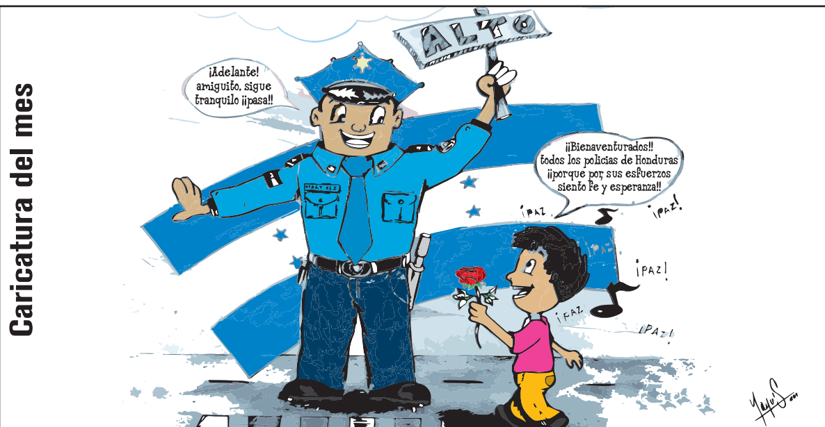
Caricatura del mes